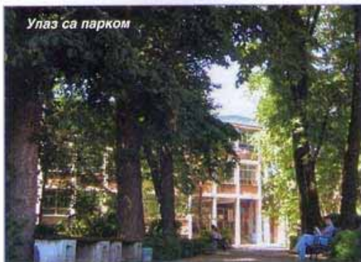
Улаз са парком