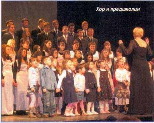
Хор и предшколци

гућава директну проходност на мастер студије. То нису, желим да нагласим овде, струковне студије након којих они могу да упишу само годину дана специјализације, већ основне академске студије у трајању од три године, након којих постоје двогодишње мастер студије. Основне академске студије у трајању од четири године дају потпуно исто звање и квалификације васпитачима као и ове које трају три, као и исту спремност за мастер. Ми смо, што је сасвим реално, сматрали да је васпитачу довољно трогодишње образовање да би ушао у васпитну групу да ради. Од наредне школске године најављујемо акредитацију и двогодишње мастер студије. Тако ћемо вероватно бити међу првима у земљи који ће понудити нашим васпитачима и мастер образовање. То је веома важно јер на тај начин ми нашим васпитачима за рад у предшколским установама омогућујемо да врло брзо, након три године, постану потпуно оспособљени и компетентни да раде као васпитачи у предшколским установама, а студентима који су амбициозни и желе да наставе образовање, омогућујемо мастер, да након завршетка петогодишњег образовања буду дипломирани васпитачи у предшколским установама. Јер, дипломирани васпитач-мастер не може да буде нико други сем оних који су завршили петогодишње